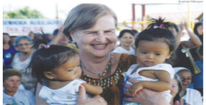
Dra. Zilda Arns com crianças indígenas.

A mulher brasileira colhe frutos de décadas de luta. Obtém conquistas no campo da política e dos direitos humanos. Ao longo de 75 anos, boa parte deles dedicados à Pastoral da Criança, a catarinense Zilda Arns mostrou ser possível acreditar em sonhos coletivos transformando o exercício da medicina numa missão de vida. Dentre tantos prêmios recebidos, citamos o diploma Mulher Cidadã Bertha Lutz, do Senado Federal em 2005. Seu exemplo será sempre inspiração para as que lutam por um mundo melhor.